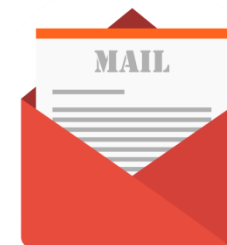
Маркетинг чрез електронна поща